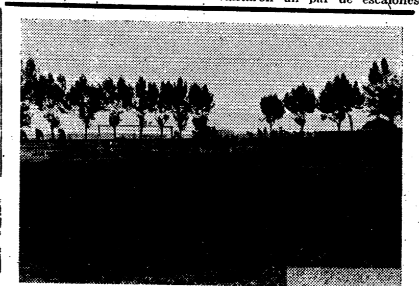
En el graderío de general están trabajando de firme un grupo numeroso de obreros que terminarán su tarea en una fecha muy próxima.