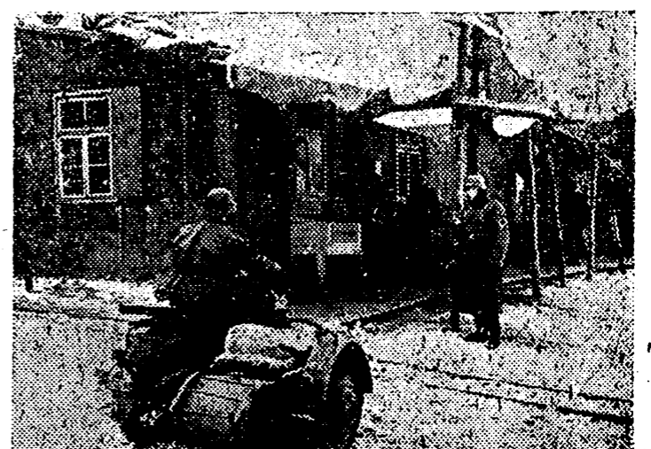
Este enlace germánico, trae la correspondencia a la Central de Correos establecida en el frente Occidental

Antes de la inauguración definitiva repetirá el viaje de pruebas. — Efe.