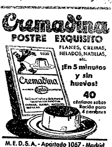
M. E. D. S. A. - Apartado 1067 - Madrid