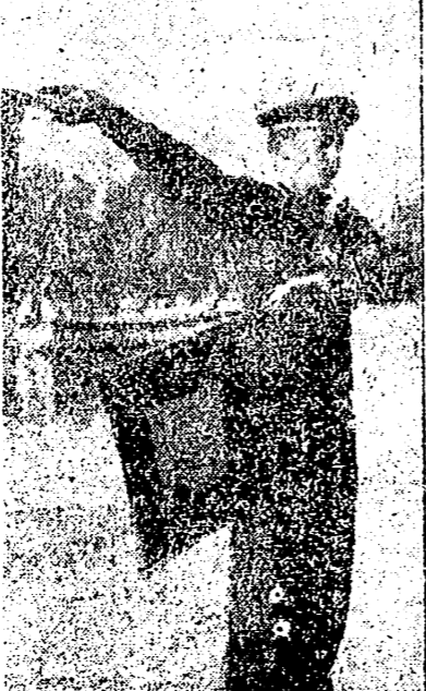
Desde un buque de guerra, este marino alemán transmite órdenes por medio de las señales de brazos

CRONICA MILITAR FRANCESA París, 13. — Crónica de la situación militar del frente Oeste, transmitida por la Agencia Havas: "El único acontecimiento digno de interés que se registró ayer en el frente francés, fué un golpe de mano alemán contra una casamata francesa colocada en la pequeña isla de Rhin al Norte de Huninghe, no lejos de la frontera suiza. Los alemanes, que contaban quizá