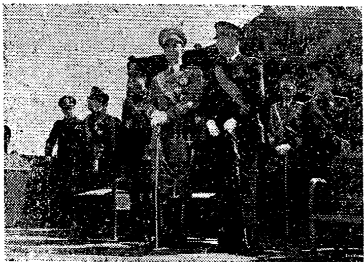
En presencia del Príncipe de Piemonte y del Ministro de Cultura Pavolini, es inaugurado en Bardighera, el monumento a la Reina Margarita.

Año III — Castellón de la Plana, domingo 14 de abril de 1940 — Núm. 570