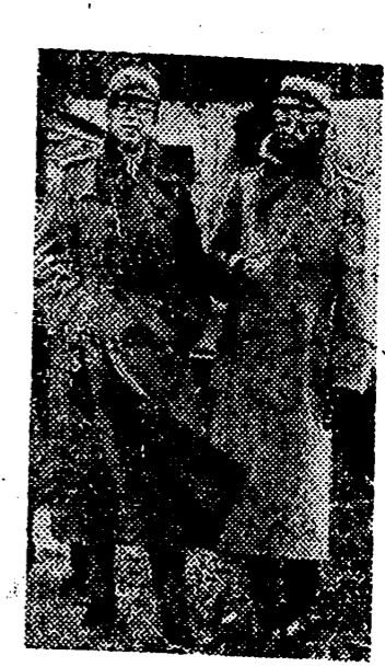
Acompañado de su hijo el Príncipe heredero, el Rey Gustavo de Suecia presenció unas maniobras militares del ejército sueco, cuyo país ha tenido tan principal parte en la resolución de la guerra ruso-soviética.

El Ferrol del Caudillo, 13. — El Racing, no participará en el torneo de Subcampeones. — Cifra.