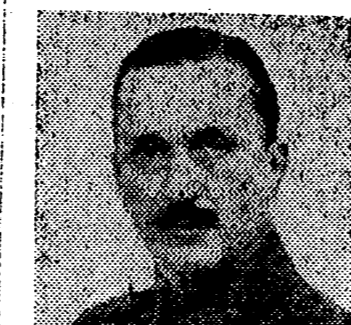
El General Carl Gustav Mannerheim, jefe supremo de las heroicas tropas finlandesas en su lucha ya terminada contra la U.R.S.S.

Helsinki, 13. — Se confirma la dimisión de los Ministros de la