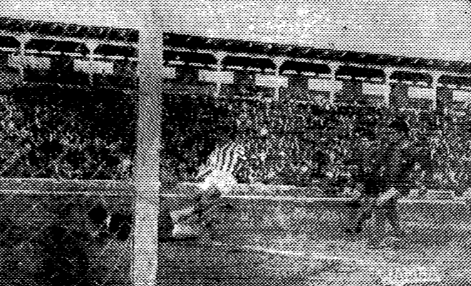
EL CASTELLON ESTUVO BASTANTE EN EL ANEA DEL EXTREMADURO...