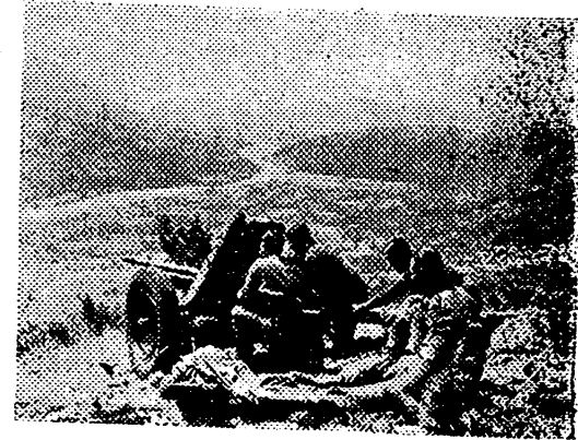
Cañón antitanque alemán en posición en las alturas de Grecia.

A fines de 1936 recibió el mando de la Di-