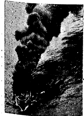
Densas nubes de humo sobre el Atlántico. El mercante inglés "Olympia", alcanzado por bombas alemanas en el momento de hundirse.

Alg. ciras, 12. — Al aterrizar en Gibraltar una escuadrilla de 12 aparatos, uno de ellos capotó y se destruyó en el suelo. Los cuatro tripulantes resultaron heridos y el avión arrolló además a varias personas, que resultaron heridas.—Cifra.