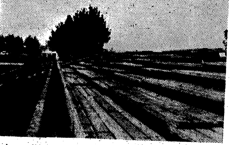
La ampliación de graderíos hecha en el Sequiol con vistas al partido es, como puede verse en la foto, algo de bastante consideración. Se calcula que dará alojo a que unas 4.000 personas más presencien el partido; pero lo bueno es que aún montados solo meza magnífica y en forma tal que quienes en ellos se colocan estarán más cómodamente aún que los que empleen las gradas ordinarias ya que por su anchura y altura de los escalones permiten que todos los espectadores dominen perfectamente el campo.