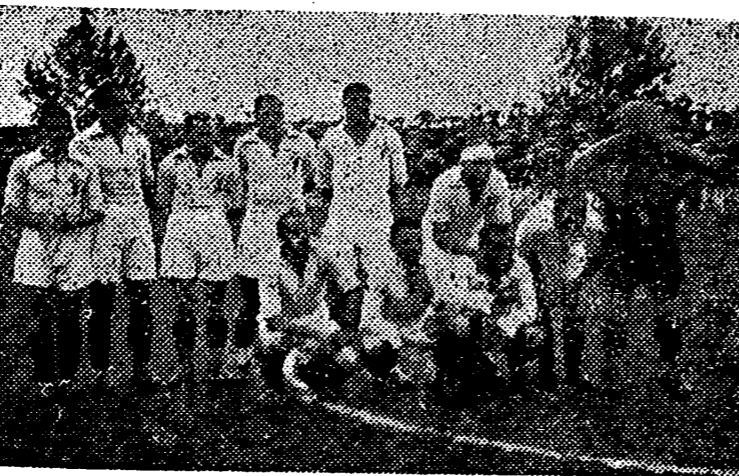
Los muchachos de Vigo parecían tener frío al comienzo del partido. Pero ya se sonrieron pensando en la mala pasada que el agua iba a jugar al Castellón. Esperemos verles en otra ocasión menos desfavorable a los del Sequiol.

Esta «Galería» podría llevar un subtítulo: «Martínez, o el rápido progreso».