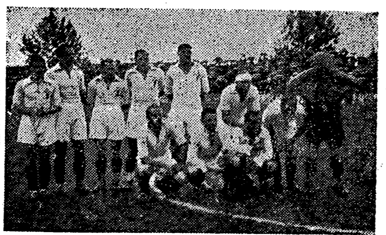
Los muchachos de Vigo parecían tener frío al comienzo del partido. Pero ya se sonrieron pensando en la mala pasada que el agua iba a jugar al Castellón. Esperemos verles en otra ocasión menos desfavorable a los del Sequiol.