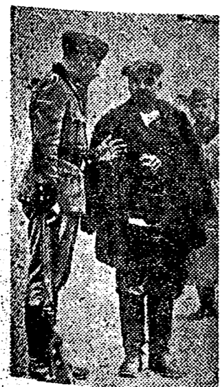
He aquí al General soviético Romanov que mandaba una de las Divisiones aniquiladas en Ucrania, desfilando por las fuerzas alemanas cuando trataba de huir disfrazado de campesino, después de dejar sus tropas abandonadas a la acción de los soldados germanos.

Ninguna de las exposiciones nacionales anteriores ha logrado obtener una participación