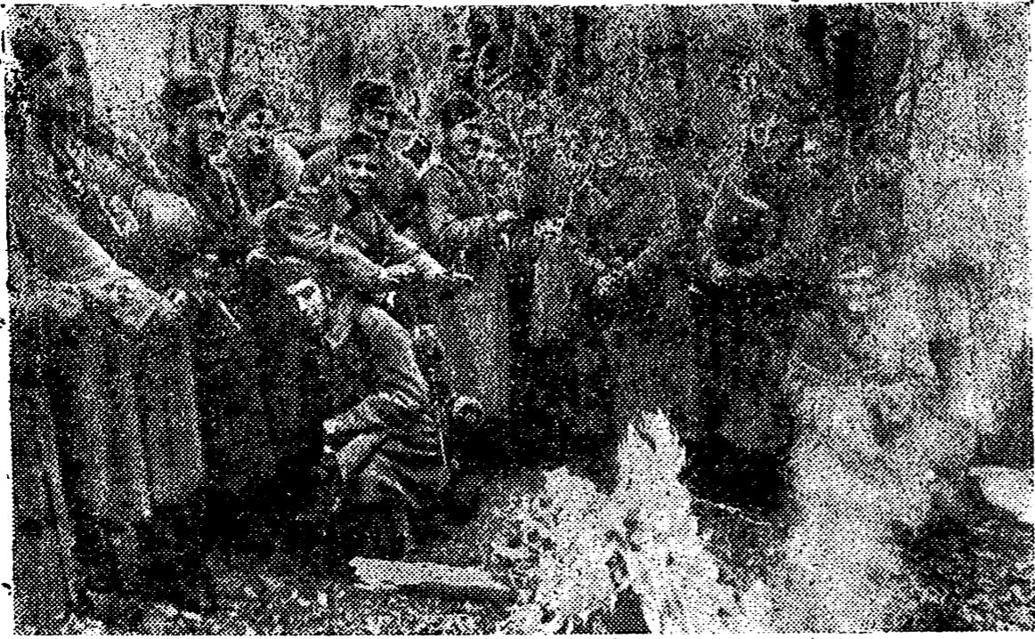
Aquí están, junto al fuego que caliente no por sus cuerpos, los soldados de España que combaten en tierras rasas. Adelantados de un pueblo que, como el nuestro, fue paladín de toda gran empresa, los jóvenes héroes de nuestro tiempo y de nuestras tierras, sonríen ante la máquina porque saben que más adelante, la fotografía acogerá las miradas de los que permanecemos en la Patria. Hombres de todas las raciones españolas, llevaron a Rusia el aliento que siempre movió a nuestra raza. Y, ahora, nosotros los guardamos en lo mejor de nuestros recuerdos y queremos que, con nuestra gratitud, caiga sobre ellos la bendición de Dios, en estas próximas fiestas navideñas, en las cuales además del recuerdo patrio, tendrán el obsequio generoso de quienes nos sentimos defendidos y fuertes merced a su heroísmo.