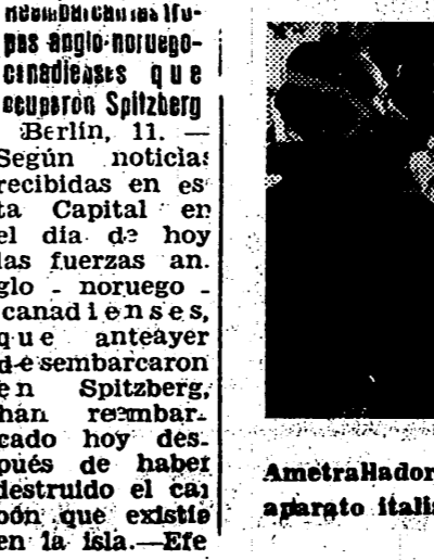
Ametrañador y radio telegrafista de un aparato italiano, durante una sesión frente al enemigo.

Secretario particular del Embajador de Alemania, en representación del mismo, el Secretario Provincial del Movimiento, en representación del Jefe Provincial, los Gobernadores Civil y Militar y todas las Regidoras y Auxiliares de Servicio de la Sección Femenina.