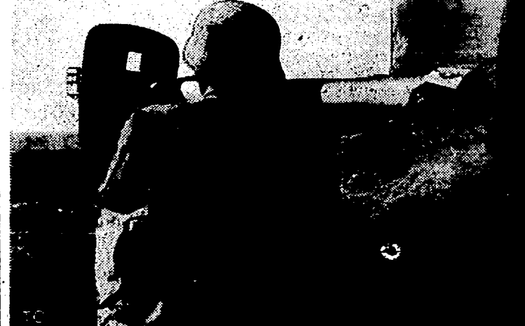
Un soldado alemán empleando, en el frente de Normandía, la nueva y potente arma antitanque de que han sido dotadas las unidades especiales germanas.

IPIONA, ENSIVA ante tan que hoy de la Es. afrontar el tropic aliadas, ni nada naves retrarán hasta regiones metrop. to tanto amenazas del —ha de la japo. cia sus cinco Cen forzada acanar. rios suó reali z en las probable do eye, muchos tienden de sus el Japon sus ene. posible do asi resisten rioridad el are. Les Fe. erzas de acumu. ante las perales. te no es que de S. japo. choque Pacifi n la ha ones, a los son nión. la flota a japo. gro que s sobre imperio TARSE OBRA? para la de. a. on de aliado, conteci la que ollando ncias ex. nte la Ma. os en y la aponesa las Bom nfirmar el repre. a japo. y aún la que te, de robable s. Por. ayores gilancia prevén que nte que se da más