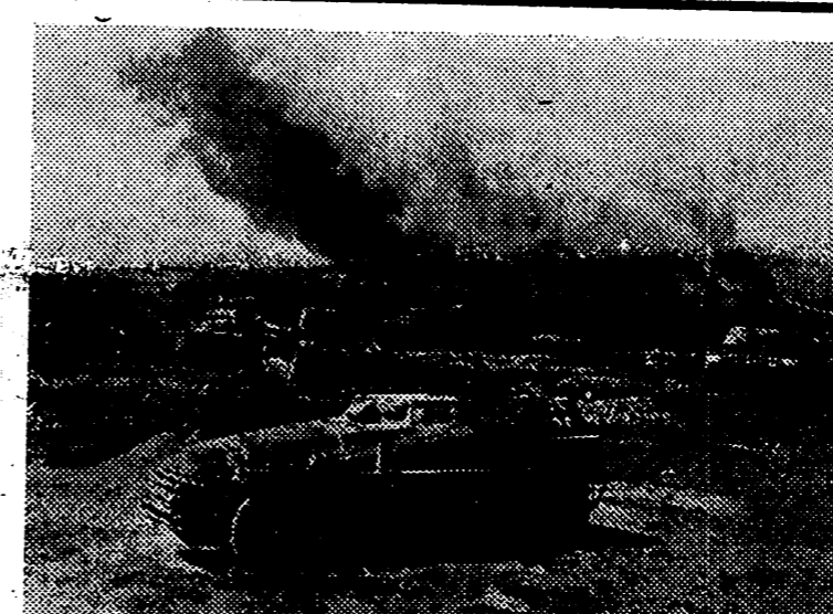
La guerra en el Este, ha ofrecido impresionantes detalles de la acción de las furzas blindadas del Reich. He aquí una sección de tanques iniciando el ataque contra la ciudad soviética de Sluk.

La noticia ha causado excelente impresión en todos los medios musulmanes que alabar la generosidad y largueza de Muley Hassan. — Cifra.