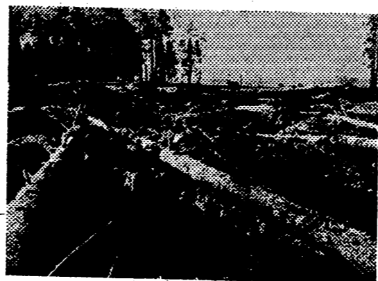
A ambos lados de las carreteras voladas, camuflándolas con árboles y ramaje, los rojos abrieron trampas de tres metros de profundidad para cazar los tanques alemanes, los cuales supieron evitar esta anzaga soviética.

El Caudillo abandonó la Catedral a los acordes del Himno Nacional interpretado por el órgano.