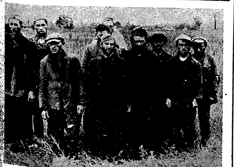
Ejemplares del Ejército rojo que han caído en manos de las fuerzas alemanas. Todos ellos son francotiradores judíos, con su rabino, ese sujeto barbudo que los preside.