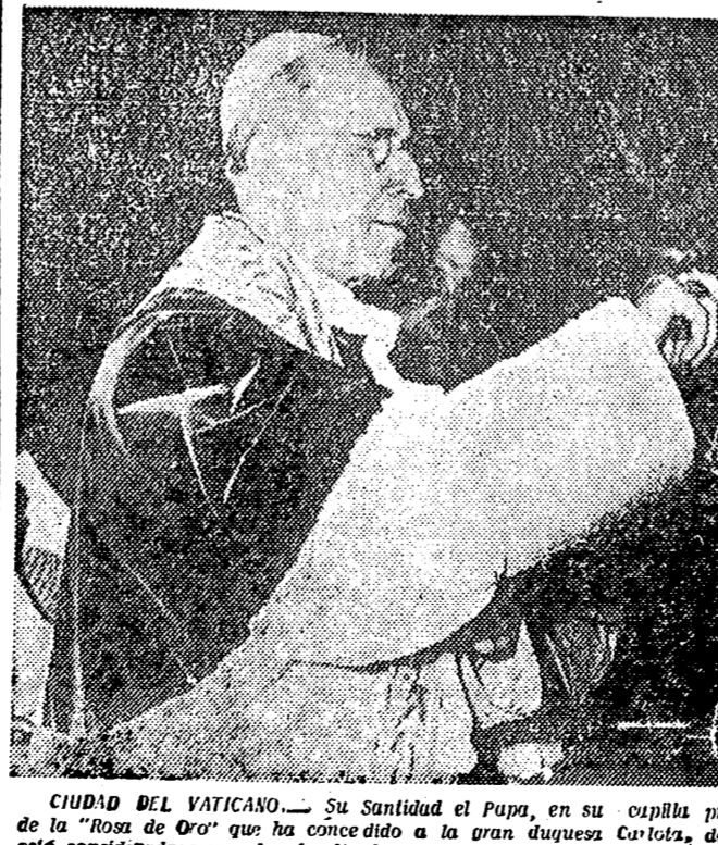
CIUDAD DEL VATICANO. — Su Santidad el Papa, en su capilla privada, procede a la bendición de la "Rosa de Oro" que ha concedido a la gran duquesa Carlota, de Luxemburgo, la "Rosa de Oro" está considerada como el más alto honor pontificio.