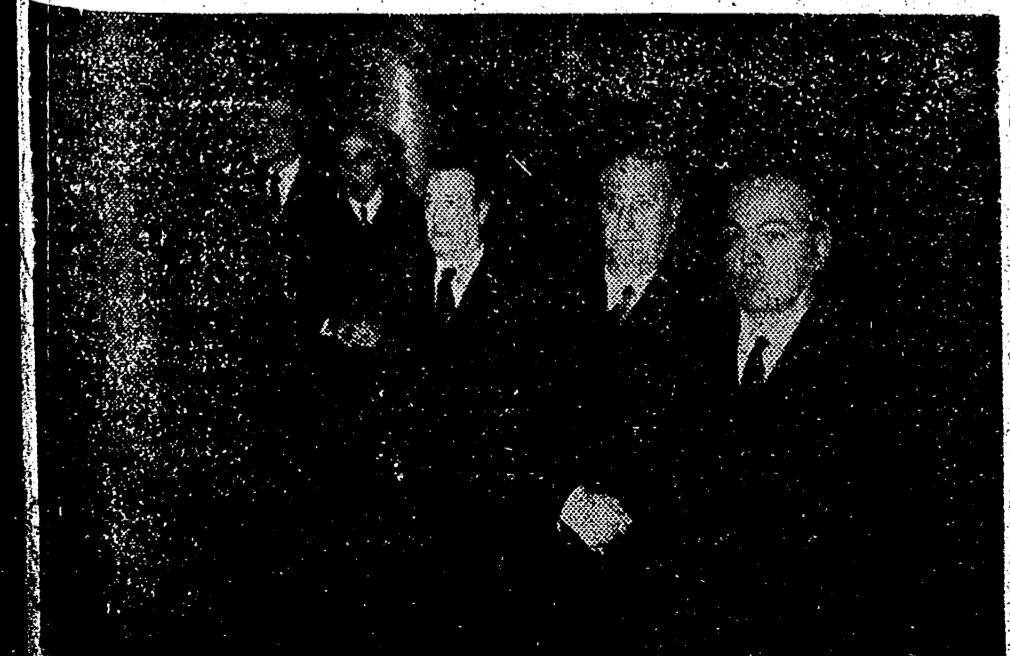
MADRID. — Los ministros Secretario General del Movimiento, Trabajo y Justicia que asistió a la misa celebrada en el templo de San José, por los Mártires de la Tradición, durante la celebración del Santo Domingo.