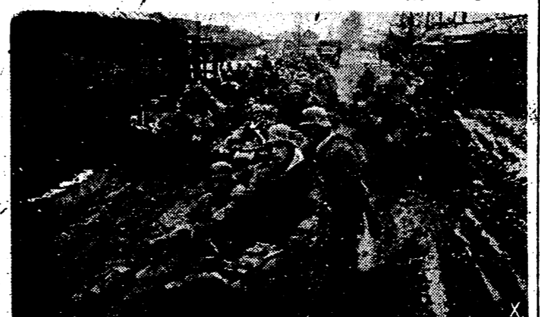
En el frente de Rusia los alemanes emplean secciones de tiradores motorizados que realizan rápidas incursiones en terreno ocupado por el enemigo para destruir determinados centros de resistencia y conseguir información sobre las posiciones soviéticas.