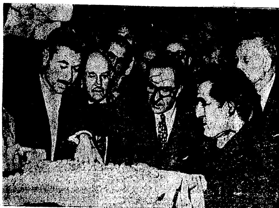
BARCELONA. — La foto muestra un momento de la visita efectuada por el Ministro de Comercio, señor Ullastres, al mercado del Borne de esta ciudad. Le acompañaban las autoridades barcelonesas.

MADRID, 10. (PYRESA). — La economía portuguesa ha sido orientada por los principios del equilibrio y de la estabilidad interior y exterior de la moneda" ha dicho el Ministro de Economía de Portugal, profesor Teixeira Pinto, en la conferencia pronunciada en el salón del Consejo Superior de Investigaciones Científicas, bajo el título "Aspectos y perspectivas de la economía portuguesa en el continente europeo". El acto fue presidido por el Ministro de Educación Nacional, señor Lora Tamayo, acompañado del Ministro de Industria, señor López Bravo, Comisario General del Plan de Desarrollo, señor López Rodó, Embajador de Portugal en España señor Da Cámara Pinto Coelho, y profesor Fuentes Quintana, Director del Instituto de Economía "Sancho de Moncada" del Consejo Superior de Investigaciones Científicas, que hizo la presentación del conferenciante. El señor Teixeira Pinto se refirió a la evolución de la economía portuguesa, y a su futuro dentro del continente europeo. Comentó la política de desarrollo económico de su país, traducida especialmente por la ley de reconstitución económica (1953-50) y por los planes de fomento (1953-55 y 1959-64) los objetivos globales cuantitativos para 1967 son sencillos y ambiciosos para el Portugal europeo: alcanzar el producto interior bruto (PISA A LA SEPTIMA PAG.)