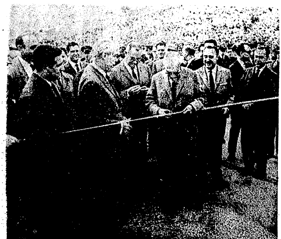
BARCELONA. — El Ministro de Obras Públicas, D. Jorge Vigón, ha inaugurado los nuevos accesos a la Costa Brava, ensalzando la carretera nacional de Madrid con la Junquera. En la foto, el Ministro señor Vigón corta la cinta en el momento de inaugurar la nueva carretera. Le acompañaban las autoridades.