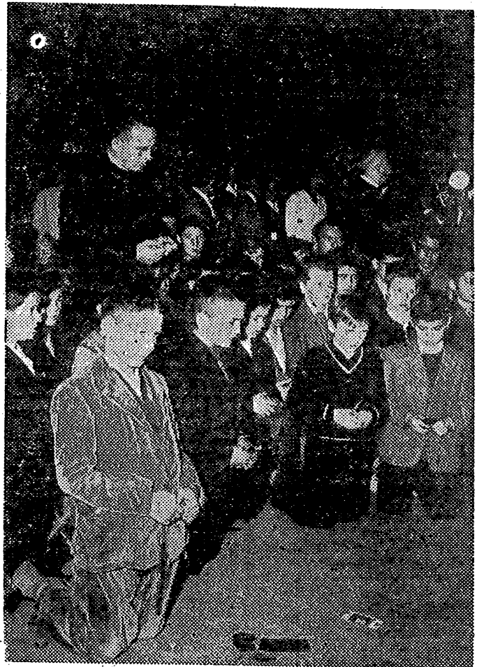
CASTELGANDOLFO. — Muchos del Colegio Ultramarino de Roma rezando por el Santo Padre, en la plaza donde se levanta la residencia veraniega de Su Santidad.

Ahora, la Constitución de 1955, adoptada precisamente por Pío XII, para los funerales y la sede vacante, confieren al Sacro Colegio que en caso de que el Pontífice muera en otra sede, tiene facultad para disponer un digno y decoroso traslado a San Pedro. Después de todas estas fases, que han sido transmitidas por la televisión italiana, ya tendió su fin ante la Basílica de San Pedro, donde llegó el cortejo presidido por la banda de carabinieri, de un regimiento de granaderos, del estandarte del Ayuntamiento de Roma, con sus custodios. Nos hemos dirigido a la parroquial Basílica de San Pedro, donde hemos visto llegar el cortejo fúnebre de Pío XII. A la entrada, la capilla Sixtina ha entrado los restos, y Monseñor Dante, Prefecto de las ceremonias pontificias, dirige el orden de la carrera. Esperando al Papa, y en nombre de la Basílica de San Pedro, su Arzobispo, el Cardenal Teichmann. A ambos lados del féretro se apoyan los Cardenales presentes en Roma, entre los que vimos a los Cardenales Spellman, Agagianian, Artega, De La Habana, Cignani, y a otros presididos por el Cardenal decano Tissierant. La gran nave de San Pedro, que tantas veces vió sobre la silla gregoriana, en clamor de multitudes, agitando sus manos benedictoras, lo vea entrar ahora en penumbra, y en silencio. Al finalizar, aquello que era espectáculo de su pontificado, como un símbolo, quedaba en la oscuridad, es de-