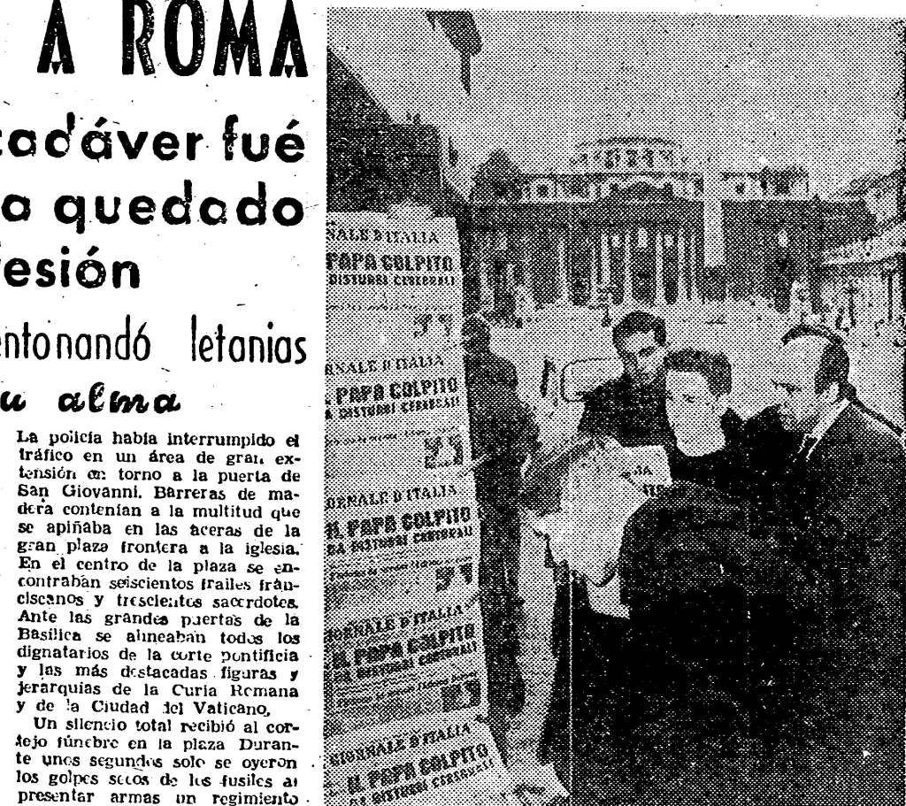
ROMA. — El pueblo romano y el mundo entero siguieron con gran ansiedad las noticias relacionadas con la salud del Santo Padre. En la foto, unos sacerdotes leen con avidez, en un puesto de periódicos, frente a la Basílica de San Pedro, las noticias sobre el estado de Su Santidad, la víspera de su fallecimiento.

TRASLADO DE LOS RESTOS DE PIO XII A ROMA ROMA, 10. — Unas cincuenta mil personas contemplaron en Castelgandolfo la partida del cortejo fúnebre con los restos de Su Santidad Pio XII. Unos diez mil policías jalaban la ruta desde el palacio papal de verano hasta las puertas de la Basílica Catedral de San Juan de Letrán. Después de haberse permitido hasta el momento que fieles y peregrinos desfilaran ante los restos mortales de Su Santidad, a las tres y veintiséis minutos