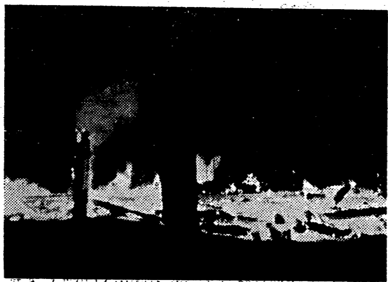
Las aldeas soviéticas incendiadas, iluminan el victorioso avance del Ejército alemán. En su retirada, los rojos prenden fuego a pueblos y ciudades, dejando a la población sin viviendas ni recursos de ningún género.

También ha acordado aumentar los sueldos y jornales a los empleados y obreros municipales.—Cifra.