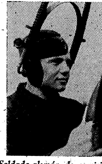
Soldado alemán de servicio en un aparato de escucha, impresionado en la defensa antiaérea