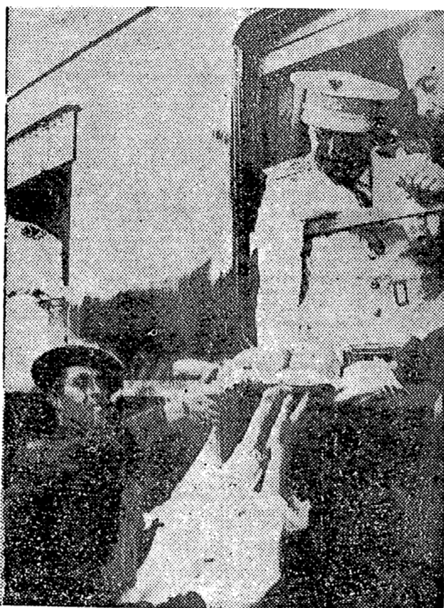
SANTIAGO. — En una de las estaciones del trayecto y durante la inauguración del tramo Carballino-Santiago, del ferrocarril de Zamora-Orense a La Coruña, dos muchachas ataviadas con el traje regional ofrecieron a S. E. el Jefe del Estado los frutos del país.