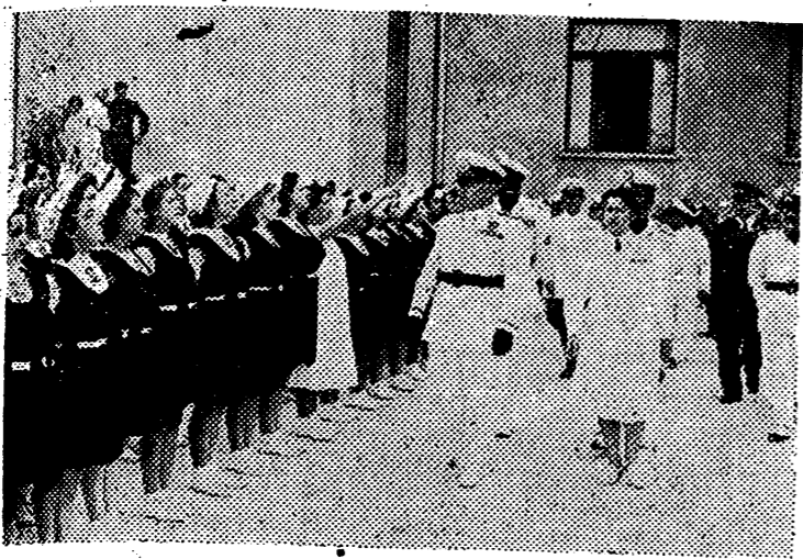
El Duce pasa revista a las formaciones femeninas de las Juventudes Italianas del Littorio.

Año III Castellón de la Plana, miércoles 11 de septiembre de 1940 Núm 698