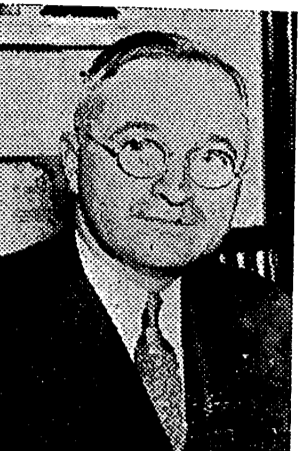
San Luis (Missouri, EE. UU.). En el lugar donde se ha erigido el monumento nacional norteamericano a Jefferson, el Presidente Truman ha pronunciado un discurso, en el cual atacó claramente a la Unión Soviética por su cínico desprecio hacia los principios de la humanidad.

Afirma que el gobierno soviético ha actuado con cínico desprecio de los anhelos de la humanidad Y le hace responsable de todas las preocupaciones que hoy conmueven al mundo