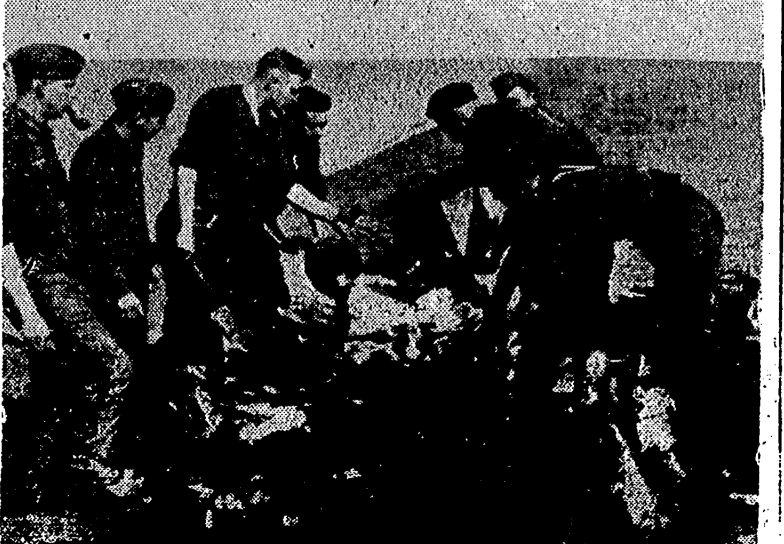
Los soldados alemanes alternan los trabajos de fortificación en los países ocupados con deportes y distracciones como esta del fútbol que les ha producido una buena presa.

Todos los afiliados a F. E. T. y de las J. O. N. S. en calidad de Militantes o Adheridos, a excepción de las Centurias Permanente, Segunda y Tercera, pasarán por esta Secretaría Local hoy y mañana, de 9 a 1 y media y de 4 a 8 de la tarde, para recoger la tarjeta de control que acredite su asistencia a la concentración.