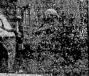
Este es, insisto, el gran secreto de esta ópera. ¿Quién no

Tal es la fuerza de estos dos amores que en los momentos de verdadera necesidad, las dos mujeres, acuden a buscar ayuda (no material que por su condición de bohemios no les pueden dar) el verdadero amor. El que vibra a su mismo compás.