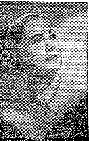
RENATA TEBALDI, la mejor y más cálida voz de nuestro tiempo, genial intérprete de las óperas del genio de Lucca. "La Bohème", es la ópera que indubitablemente, influyó de manera decisiva para hacer llegar a la cúspide.

Un programa antipático de "Scalé de Milán" ha sido el que nos ha proporcionado la noticia, que tras largas investigaciones y consultas, la gentileza de un buen amigo que ha facilitado el acceso a los mismos, ha dado como final el que hoy podamos ofrecer este artículo. Como se sabe Puccini escribió la ópera en la "Torre del Lago" y su inspiración la obtuvo en sus cotidianas visitas al "Club de la Bohème" no lejano de su finca junto a la torre referida. club al que concurrían sus amigos pintores y poetas y en el cual reinaba un ambiente "democrático".