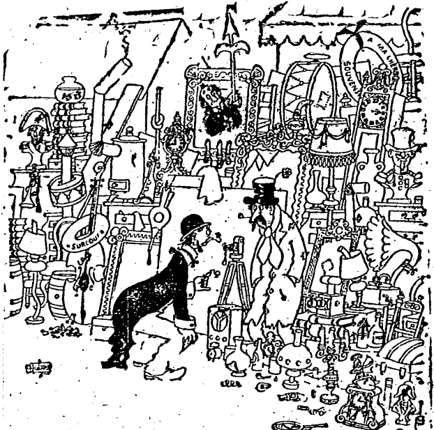
Con esta maldita gripe hay que cuidar un poco la higiene... No tendría usted un cepillo de dientes de ocasión?

se funda sobre la propiedad de la parcela de tierra árabe por la que se combate encarnizadamente. Tan encarnizadamente, por lo menos, como en las otras guerras y casi siempre, con una sombría dureza. En un tiempo en que tanto se habla de una guerra futura hecha por técnicos que se enviarán proyectiles pavorosos por encima de las cabezas de la humanidad, sin saber realmente por qué se va a combatir, en Palestina se ha vuelto a la guerra del hombre contra el hombre por un trozo de tierra.