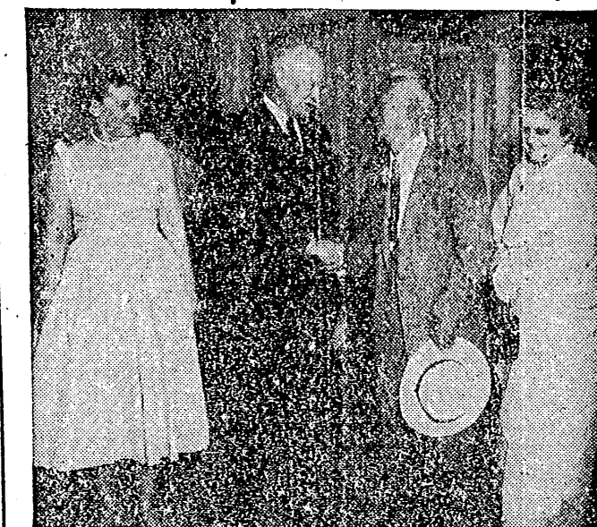
Syngman Rhee durante la visita que hizo a Norteamérica hace dos años. En la fotografía aparece el estadista surcoreano acompañado de su esposa, en unión del Presidente Eisenhower y esposa, en la entrada de la Casa Blanca.