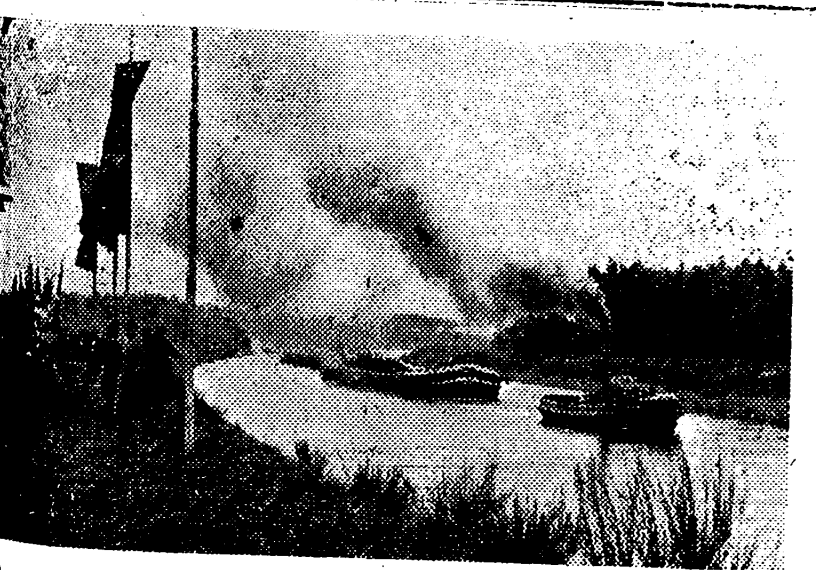
Acto inaugural del gran Canal Adolfo Hitler. La fotografía representa a las primeras embarcaciones que lo cruzaron entre Verbündung y Stadt Gleiwitz, en cuyo momento Rudolf Hess lo declaró abierto a la navegación.