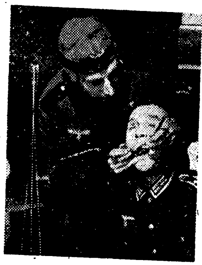
La línea Sigfrido y próximo a la línea de fuego, un dentista perteneciente al Ejército atendiendo cuidadosamente a un soldado alemán.