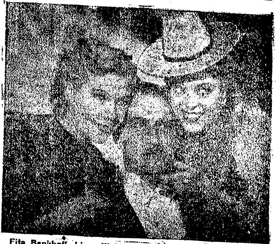
Fita Benkhoff, Lizzy Waldmüller y Karl Schonbock en la película "Casanova se casa"