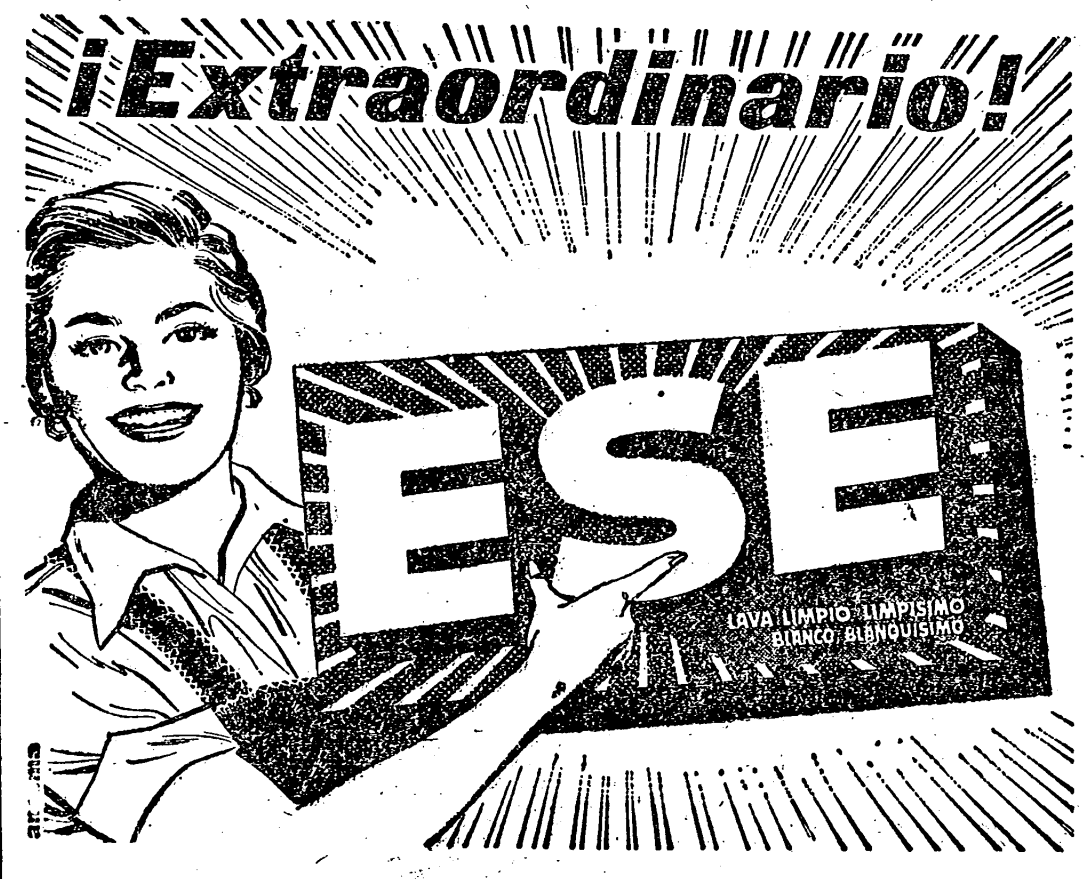
ESE DA AL INSTANTE MONTAÑAS DE ESPUMA LIMPIADORA

Se dice en el comunicado que el pacto cree que las visitas entre estadistas soviéticos y occidentales "han aproximado la posibilidad de reducir en algún grado la tensión de la guerra fría, mediante la resurrección de negociaciones sobre Berlín y el desarme". — Efe.