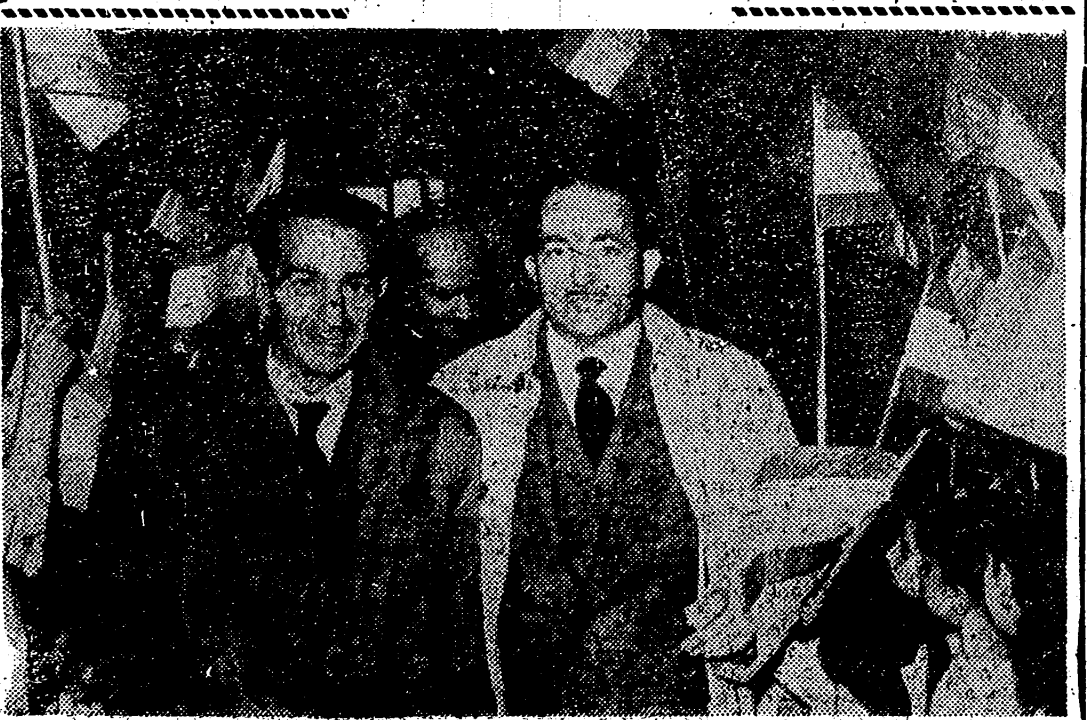
El ministro de Educación Nacional, Sr. Rubio, en su visita por tierras de Extremadura, inauguró en Guadalupe la VIII Sesión Social de 22 grupos, denominada "César Carlos I".