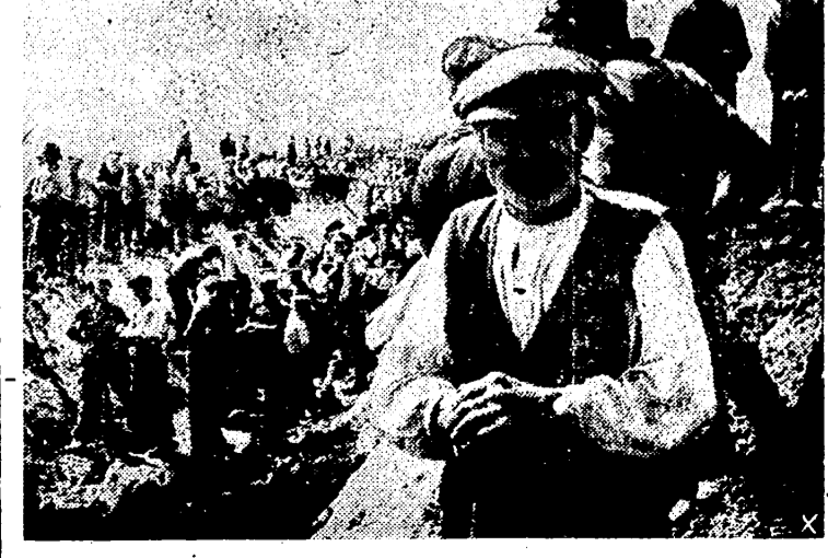
Todo el pueblo prusiano auna sus fuerzas para la construcción de un gran sistema defensivo que impida el avance de los soviets.

Budapest, 9. — Todos los húngaros comprendidos entre los 14 y 60 años, sin distinción de sexos, se presentarán ante las autoridades competentes con el fin de organizar la movilización total de la mano de obra. — Efe.