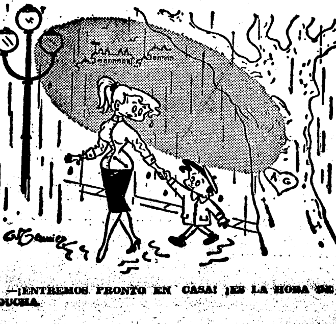
¿ENTREMOS PRONTO EN CASA? ¿ES LA HORA DE TU DUCHA.

El agente embajador expulso ESTOCOLMO. El embajador de la República Dominicana ha recibido un telegrama, "por el que se le informa de su condecoración".