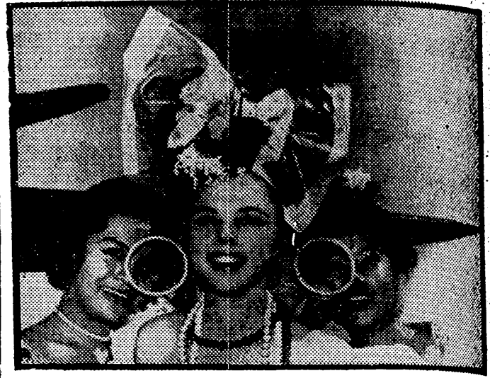
LONG BEACH. — Miss Filipinas, Izquierda, y Miss Corea del Sur, a su llegada a Long Beach para participar en el concurso internacional de bellezas femenina.