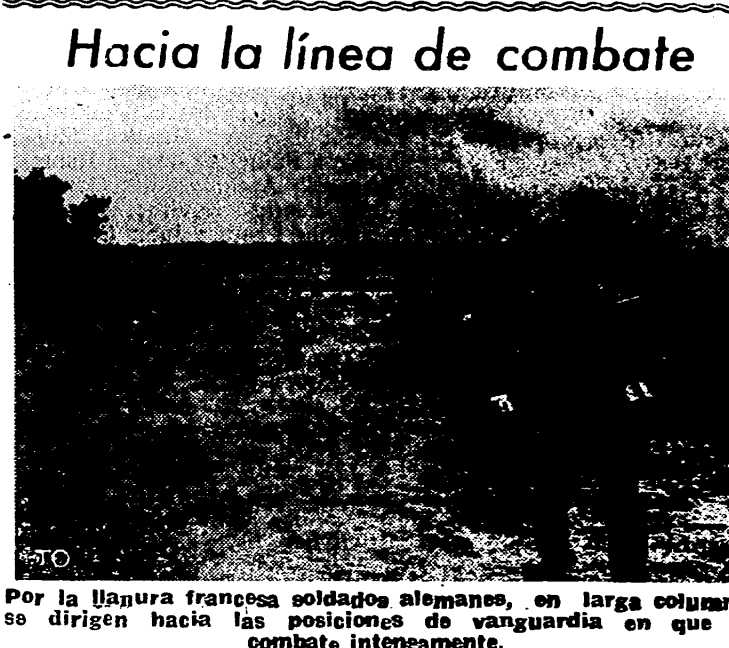
Por la laguna francesa soldados alemanes, en larga columna, se dirigen hacia las posiciones de vanguardia en que se combate intensamente.

Berlin, 9. — "Después de semanas de retroceso ha llegado el tiempo de resistencia rígida en el frente del Este, ha declarado el comandante jefe del sector central, mariscal Model. "Confianza en que los esfuerzos de la guerra total que aportan al frente de combate hombres y armas, defenderán nuevamente el bastión contra el adversario soviético y lo harán inexpugnable."—Efe.