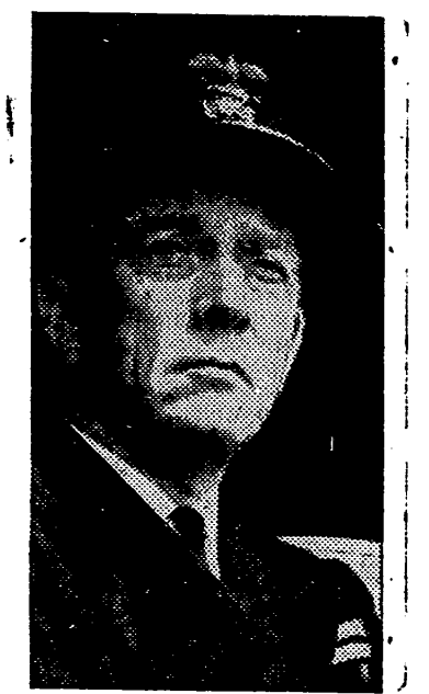
El contralmirante norteamericano Kirk, jefe de las fuerzas de choque de la Marina de los Estados Unidos.