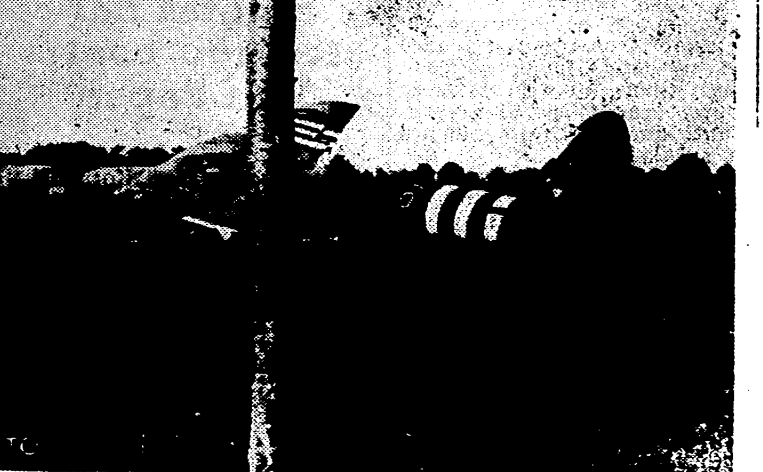
Un planeador norteamericano, destruido en la retaguardia del frente alemán en Francia.

DIAR... AR... N... se... Hemos cido y aque... en todos... ciamen... echó sobr... no a ser... obligació... constante... y 'legisla... exigencia... la mayor... de la cont... La faja... ría en la... trucción... social y e... na era en... cas, cov... odio y n... eación y... nizaría... universal... tido de u... organizac... porque lu... prestigio... toda la o... na en el... circunscr... creyera s... posibilidad... vimiento... vancia tan... ex... vidual y... nos en te... suramen... oriente ja... El prim... toda emp... la falta d... tales hac... por cuya... toda na... siglos de... antispau... diaba n... da de su... zación so... de los ho... ordenació... feliz de... profesión... que no co... de recupe... Asi la re... han de r... de de... Patr... de la mar... cauces de... sino en el... de su des... de restar... sino de d... tamiz del... el can... que la acc... Pero el... también e... pueblo ha... su empen... mos del E... mecanis... ción viva... vicio de l... mendada... Por cho... correspon... fue tan c... de divulg... pueblo si... mente y... España... firme en... coger la... ha inflit... con el va... debe dar... altos dest... CO... EL... L... Gran... Fuhrer, de las F... nas com... "En el... y de... violentos... fuerzas... penetrad... Al NO. d... chazados... del em... contratado... violentos... 108 carr... León... mus... CA... con... Londr... ex presi... cés, ha... concentr... una info... moscovit... Efe.