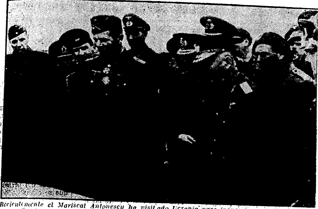
Recientemente el Mariscal Antonescu ha visitado Ucrania para inspeccionar los trabajos de reorganización emprendidos bajo la nueva Administración. En Sebastopol escucha de boca de unos oficiales rumanos y alemanes las explicaciones sobre los incidentes de la conquista del fuerte «Máximo Gorki».