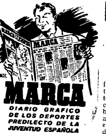
Administración, Carretas, 10. — Madrid.

de Italia. Cinco aparatos adversarios fueron destruidos en el curso de estas operaciones, y otros dos durante la noche anterior. Diez aparatos propios no regresaron. Informes posteriores indican que seis de nuestros aviones no regresaron de las operaciones contra Augusta, además de los dos ya señalados.» — Efe. BRONTE HA SIDO OCUPADA, SEGUN RADIO ARGEL Argel, 8. — El locutor norteamericano de Radio Argel anuncia que Bronte, situada al Noroeste del monte Etna, ha sido conquistada por las tropas aliadas. — Efe.