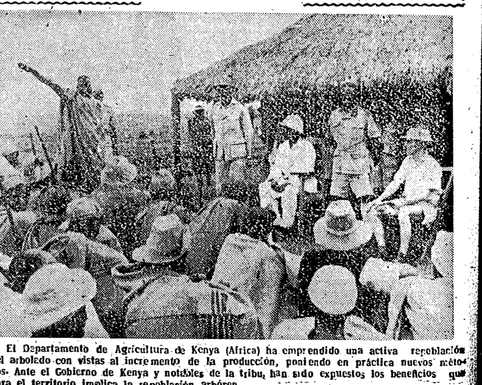
El Departamento de Agricultura de Kenia (Africa) ha emprendido una activa repoblación del arbolado con vistas al incremento de la producción, poniendo en práctica nuevos métodos. Ante el Gobierno de Kenia y miembros de la tribu, han sido expuestos los beneficios que para el territorio implica la repoblación arborea.