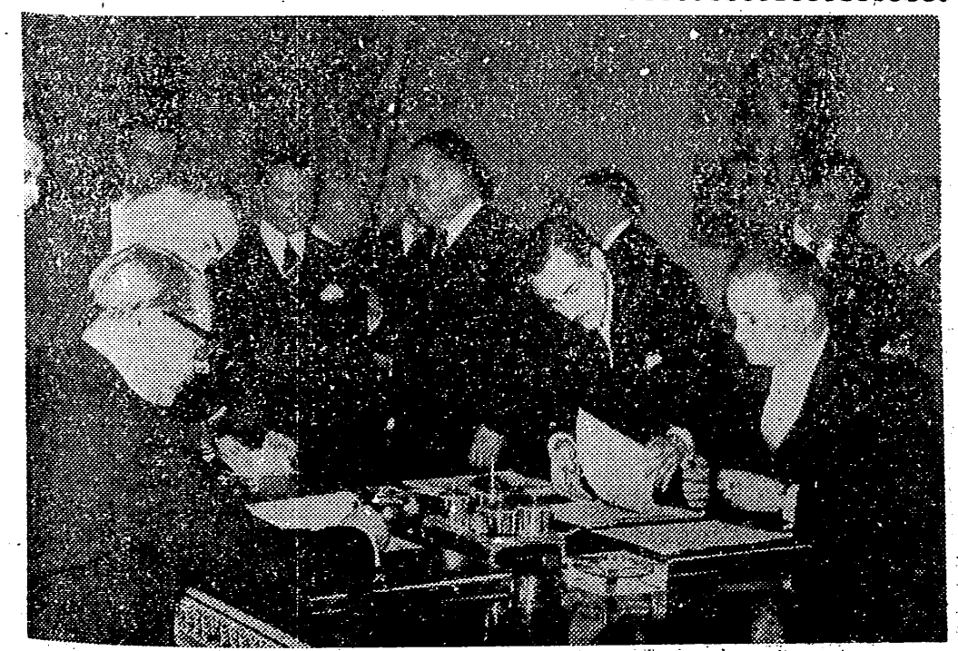
MADRID. En el Ministerio de Asuntos Exteriores se han firmado dos acuerdos entre España y la República Federal alemana, sobre efectos de la segunda guerra mundial, el primero, y sobre rehabilitación de derechos o preferencias irredustibles. En la foto, un momento de la firma por los señores Castiella y Von Brentano, ministros de Asuntos Exteriores de España y Alemania occidental, respectivamente.

Veinte mil toneladas de patatas de importación en camino hacia el puerto de Cádiz, donde se aguarda en un puerto para cubrir la corta cosecha de esta zona. Con la nueva cosecha se restablecerá la libertad del mercado y de la Cifra.