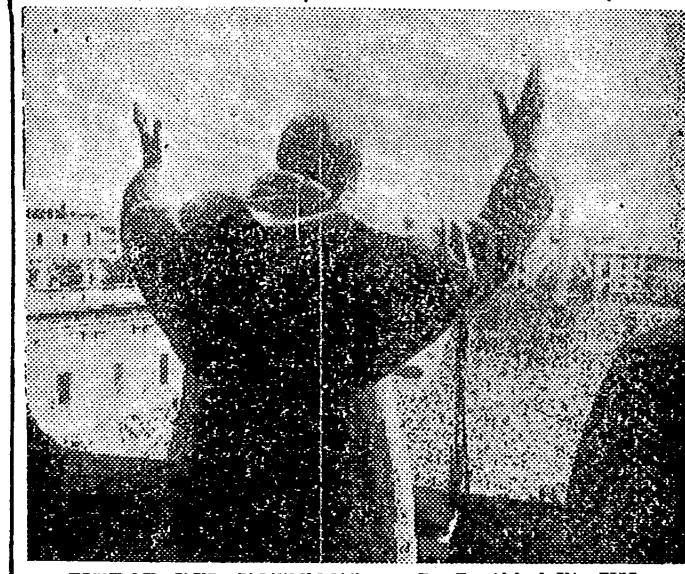
CIUDAD DEL VATICANO. — Su Santidad Pío XII en el momento de impartir su bendición "Urbi et Orbi", desde el balcón de la Basílica de San Pedro, el Domingo de Resurrección. Se calcula en 200.000 personas las que llenaban la plaza de San Pedro.