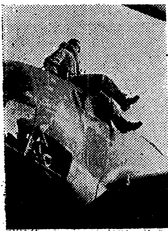
Un «HE 111» regresa a su base tras una acción sobre Inglaterra. Uno de los tripulantes del aparato, saltando a tierra