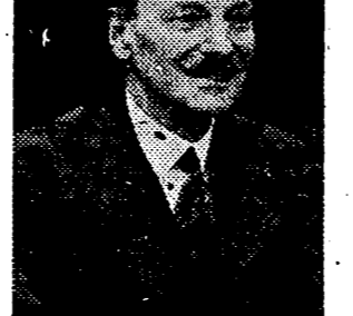
Atlee habrá de guardar reposo

UNA PAUSA EN LA REUNION DE LOS GOBERNADORES Londres, 8. — El portavoz del Ministerio británico de Asuntos Exteriores ha declarado que habrá una pausa en la Conferencia entre los cuatro gobernadores militares de Berlín, ya que los informes sumarios de las reuniones celebradas hasta ahora han de ser estudiados antes de nuevas entrevistas.