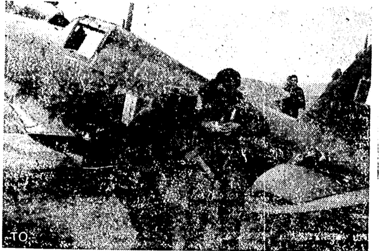
La aviación fascista republicana italiana coopera en muchos puntos con la Luftwaffe. Aquí vemos a un piloto ultimando su equipo antes de emprender el vuelo.