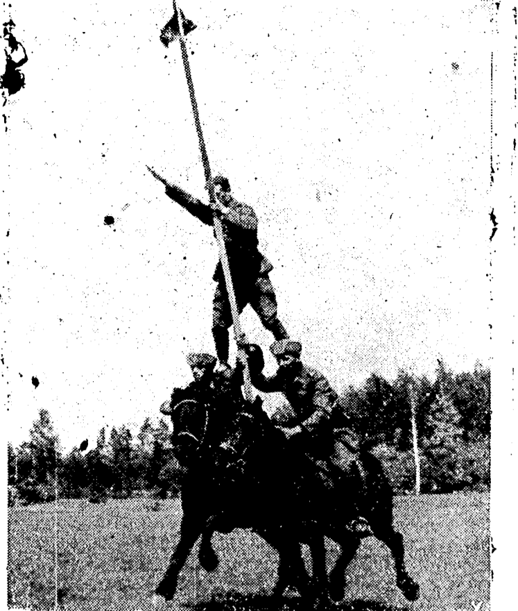
En la caballería de las fuerzas armadas alemanas figuran numerosos cosacos que en algunas de sus fiestas realizan los ejercicios acrobáticos que les han hecho famosos en el mundo entero.