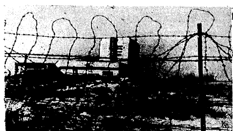
Alemania construyó en la costa atlántica de Francia imponentes fortificaciones. Una vez más en la guerra presente se ha demostrado que los medios ofensivos han progresado infinitamente más que los defensivos y hoy muchas de estas fortificaciones han sido rebasadas.