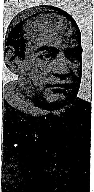
EL PADRE ANTONIO MARIA CLARET

Roma, 7. — (Del enviado especial de la Agencia Efe). — En una ceremonia de magnificencia incomparable, el Beato español Antonio María Claret ha sido canonizado por Su Santidad el Papa Pío XII. Es la primera y única canonización de un español en este siglo.