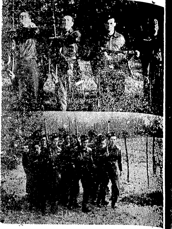
Sexto. — Protección constante prestada a las organizaciones de terroristas y guerrilleros rojos españoles que actúan desde los territorios franceses inmediatos a la frontera y que encubren estas actividades con la pantalla de dedicadas a la explotación de los bosques preboscados. (Declaración del Gobierno español acerca de las relaciones franco-españolas de 1 de marzo de 1946. Fotografía obtenida de los Cahiers Français, en la que aparece uno de los grupos de referencia).

El último discurso de Churchill, rotundo como un tajo y claro como todos los suyos, ha puesto de moda otra vez el anticomunismo. El sinc de este mundo desorientado de hoy es esta continua pendulación y esta sordera circunstancial, que hace no oír lo que sobre el comunismo dicen cada día unos hombres y en cambio incina a registrar con asombro admirativo el mismo señalar peligros cuando proceden de otras figuras. Pero el caso es que el discurso de Churchill ha vuelto a poner de moda el anticomunismo y que en él parece haberse autorizado a todos, como cuando en 1939 firmó la U. R. S. S. el pacto con Alemania, a ser anticomunistas sin plegua al calificativo tan expeditivo y descalificador de fascista.