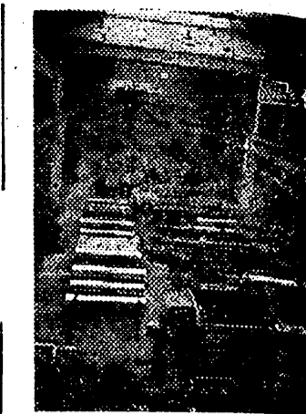
Toda Alemania es un arsenal en constante actividad para la guerra. Fabricación en serie de calderas de Aire para torpedos

El resultado de este nuevo plebiscito ha sido el siguiente: los electores de 20 a 30 años, han respondido en contra en un 90 por ciento, de 30 a 50 en un 85 y los de 50 en adelante, en un 60 por ciento. — Efe.