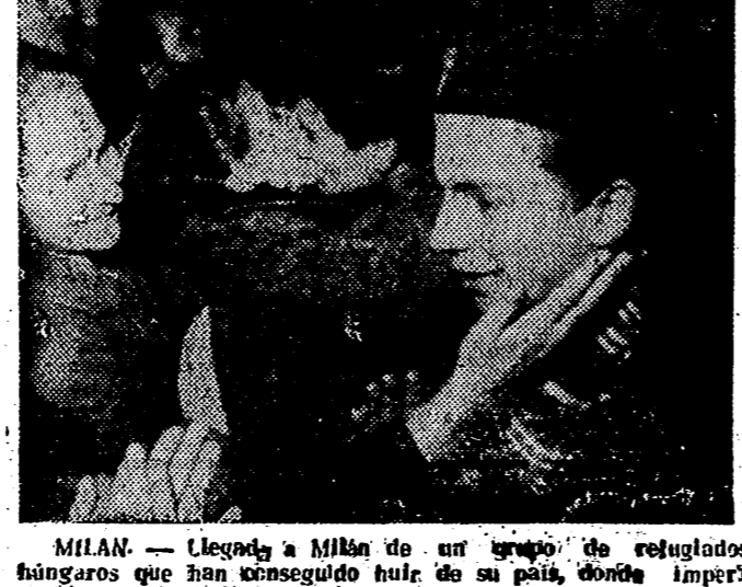
MILAN. — Llegada a Milán de un grupo de refugiados húngaros que han conseguido huir de su país, donde impera el terror soviético.