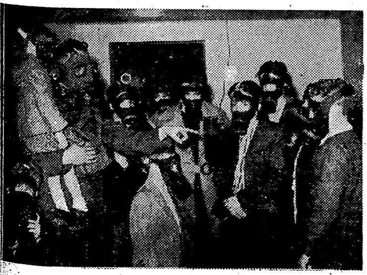
Esposas y niños de soldados ingleses de Ingenieros, escuchan las explicaciones para el empleo de caretas contra gases. El modelo de la empleada por el instructor es militar, en tanto que las de las mujeres y niños es de tipo civil.

Quedará subsistente todo lo dispuesto en el Decreto de 15 de Junio del actual año que no se oponga a lo preceptuado en el Decreto que ha sido firmado.