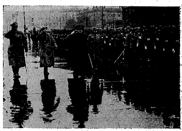
El Ministro español, señor Serrano Suñer, se dirige a depositar una corona en el monumento a los caídos en la guerra, durante su reciente viaje a Berlín.