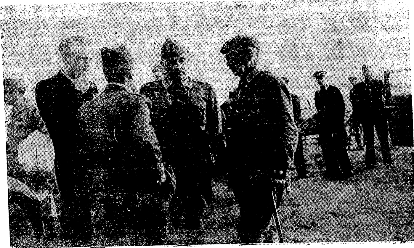
He aquí una fotografía en que muestra al Caudillo, jefe del Estado, con el general Dávila Ministro de la Guerra y el Ministro del Interior, Serrano Suñer, con otros jefes y oficiales en una de sus frecuentes visitas al frente. Las preocupaciones de la guerra no impiden al Caudillo llevar a cabo tareas de paz. Ni la organización y reconstrucción de España le hacen descuidar el frente, a ambas acude con genial soliciud.