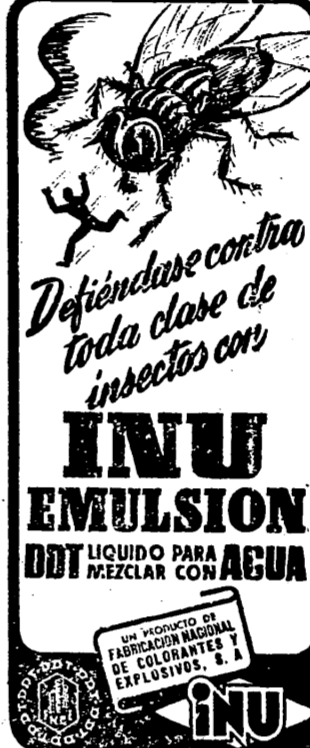
Defiéndase contra toda clase de insectos con INU EMULSION