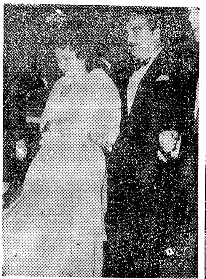
La Princesa Gracia de Mónaco que, ya asistió, en otras ocasiones al Festival de Cannes, cuando era la apañada actriz Grace Kelly, ha vuelto ahora por vez primera después de su matrimonio con el Príncipe Rainier de Mónaco.

Perdió el Valencia en Milán por 3-2. MILAN, 7. — El Internacional de Milán ha vencido a Valencia por 3-2, en un encuentro jugado con luz artificial esta noche, en el Estadio San Siro.