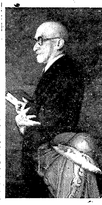
Victor Manuel III, rey de Italia, en un momento de su estancia en Lisboa.

Nueva York, 7. — El Subcomité designado por el Consejo de Seguridad para la investigación del caso español, ha celebrado hoy su cuarta reunión, que duró cuarenta y cinco minutos. — Efe.