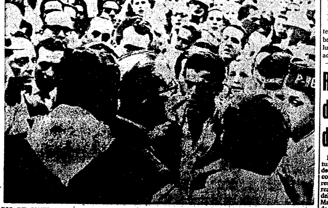
RIO DE JANEIRO. — El gobernador Carlos Lacerda (con gafas) del Estado brasileño de Guanabara, uno de los que se rebeló contra el Presidente Joao Goulart, tranquilizó a la multitud enfrente de su residencia oficial, el día 2 de abril, después que los marines pro-Goulart fueron expulsados. — (Foto Citra.)