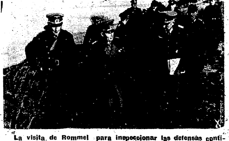
La visita de Rommel para inspeccionar las defensas continentales, ha sido detenida. Aquí le vemos en el curso de esta inspección junto con Von Runsted en un punto de la costa atlántica francesa.

JEFATURA PROVINCIAL DEL MOVIMIENTO EN MEMORIA DE CERNUDA Y VELASCO