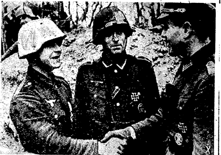
Ultimamente el comunicado alemán viene recogiendo los actos de heroísmo destacado que realizan las unidades que luchan frente al bolchevismo. En esta foto vemos al jefe de una de estas unidades distinguidas, al ser felicitado por los mandos superiores después de una dura lucha en que logró importantes éxitos.