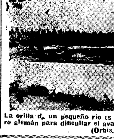
La orilla de un pequeño río es objeto de violento fuego artillero alemán para dificultar el avance de las fuerzas aliadas.