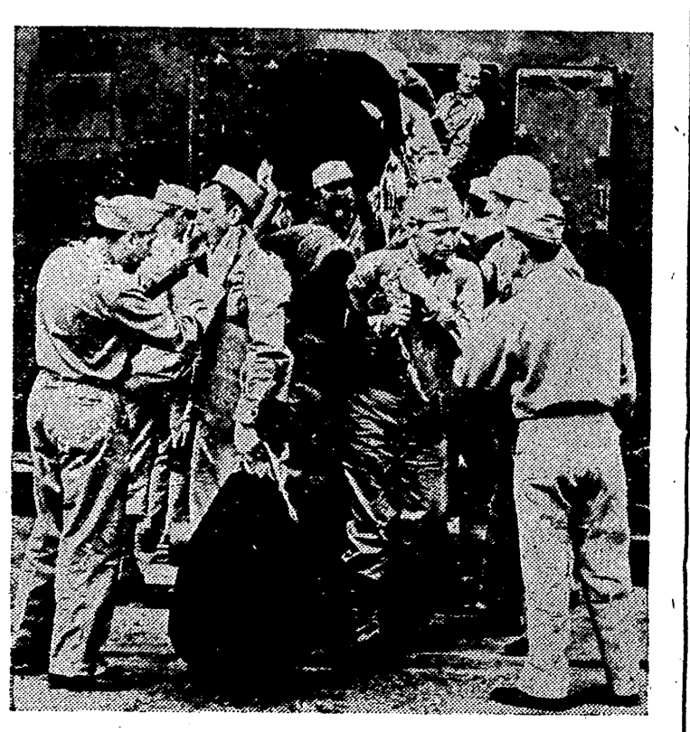
Fotografía de soldados norteamericanos mientras son examinados por los médicos militares al desembarcar en Pearl Harbour (Islas Hawaii), del transporte que los condujo.

Llegada de tropas norteamericanas a las Hawaii