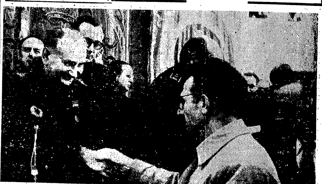
VALLADOLID. — El Ministro Secretario General del Movimiento, Sr. Arrese, acompañado del Delegado Nacional de Sindicatos, Sr. Solís, durante la entrega a sus beneficiarios de los bloques, por un total de mil ciento ochenta y dos viviendas construidas por la Obra Sindical del Hogar en el barrio de Santa Clara.

Entrega de 1.182 viviendas en Valladolid