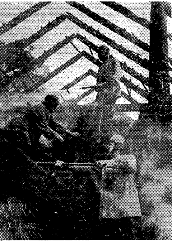
Gastadores y hombres del Servicio de Trabajo alemanes, construyendo un puente auxiliar en territorio ocupado

Nueva York, 5. — La Compañía de Navegación Aérea Americana Sport Line, anuncia que no podrá efectuar el servicio Nueva York-Lisboa, como hasta ahora, en vista de que el Congreso se ha negado a concederle la subvención necesaria para el transporte del correo. Esta ayuda oficial se elevaba a 500.000 dólares. — Efe.