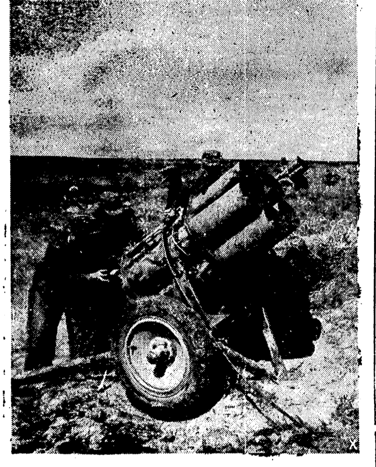
Los alemanes en los combates defensivos que están librando contra los bolcheviques emplean toda clase de armas. En esta foto vemos a unos lanzan bombas alemanas preparados para entrar en acción.