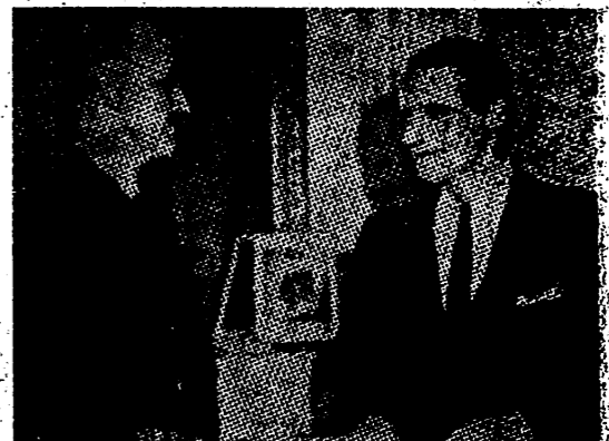
En las habitaciones de un hotel londinense reservadas al Rey Haakon de Noruega, se ha verificado la entrega de las credenciales del Embajador yanqui para la «Noruega libre», Embajador que también está acreditado —naturalmente en Londres— cerca de los Gobiernos nómadas de Holanda y Noruega.

Buenos Aires, 5. — La película norteamericana "Una voz en la noche" ha sido prohibida en la Argentina por decreto gubernamental. La película puede ser considerada como un ataque a Alemania y su representación podría comprometer las buenas relaciones existentes entre la Argentina y el Reich.—Efe.