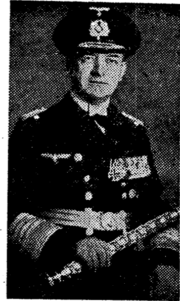
El Gran Almirante Raeder, Jefe supremo de la marina del III Reich, que en su actual viaje a Sofía, ha sido obsequiado con un almuerzo por el Rey Boris, a cuyo acto asistieron, además de los altos Jefes militares búlgaros, miembros del Gobierno y de la diplomacia alemana.

También cita a los servidores de una pieza antiaérea, que lleva derribados 21 aviones soviéticos.—Efe.