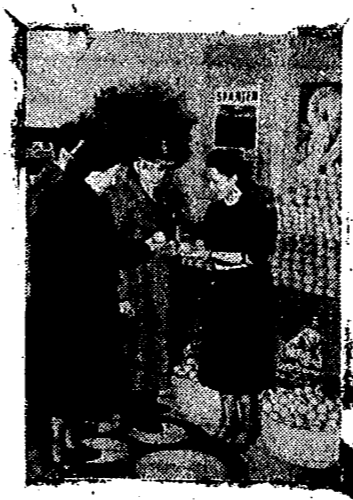
Detalle de la instalación española en la Feria, en su sección de frutas.